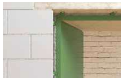
Vypĺňovanie dutín v izolácii